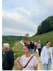
Start am 1. Mai mit Maibummel - 62 Personen nahmen teil