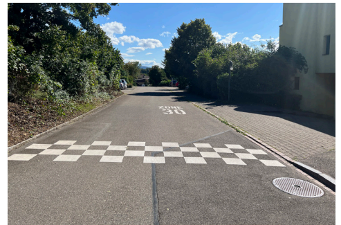
Verdeutlichung des Zoneneingangs mit einem Schachbrettmuster in Untersiggenthal