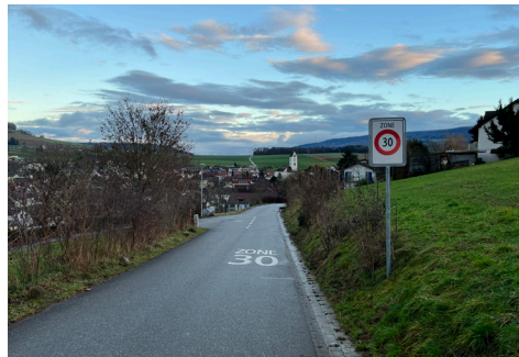
Signalständer neben Fahrbahn in Lengnau