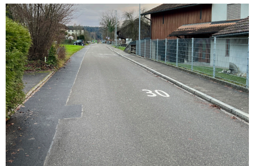
Zahl "30" auf der Fahrbahn innerhalb der Zone zur Erinnerung an das geltende Tempo-30-Regime