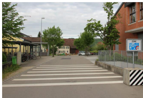
Gestaltung der Fahrbahnoberfläche in einem Schulumfeld in der Gemeinde Thayngen. Quelle: www.begegnungszonen.ch